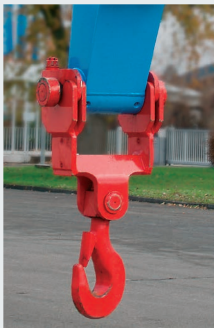
Lasthaken TLH 150 / Lasthaken TLH 160